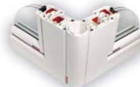
Gelenkverbindung für beliebigen Winkel zwischen den Fenstern