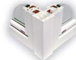
Anschluss von zwei Fenstern im Winkel von 90°